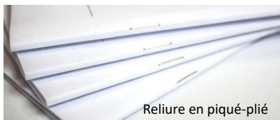
Reliure en piqué-plié